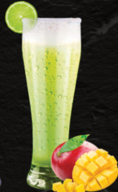
LIMONADA DE MANGO