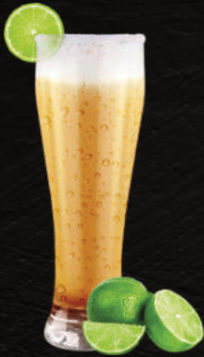
TÉ DE LIMÓN