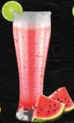
LIMONADA DE SANDÍA