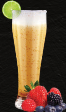
TÉ DE FRUTOS ROJOS