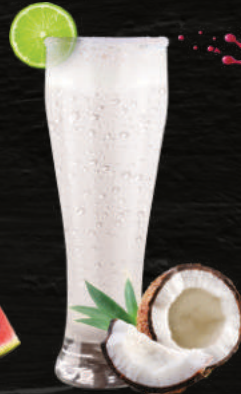
LIMONADA DE COCO