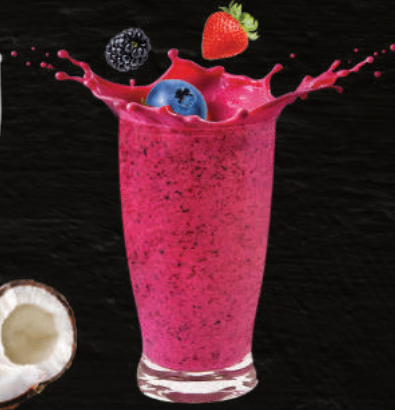
MIX DE FRUTOS ROJOS